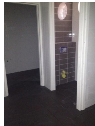
De vloer is betegeld

Ook het keukenblok is geplaatst zodat wij nu beschikken over stromend water en er is een begin gemaakt met de sjoel. Daar is eerst de grote spiegelwand verwijderd en nu kunnen we beginnen met het dichtsmieren van de scheuren, waarna kan worden begonnen met het isoleren.