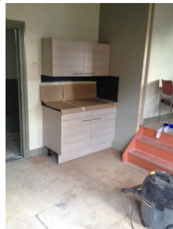
Het keukenblok is geplaatst.

Daarnaast zijn er circa 80 stoelen gekocht, zodat de geleende gekleurde stoelen terug kunnen naar de eigenaar en de bezoekers van evenementen in de synagoge toch een zitplaats hebben. Tevens zijn vrijwilligers begonnen met het uitzoeken van informatie over de voormalige Joodse Coevordenaren. Wij kunnen echter nog steeds extra klussers en speurders gebruiken om te zorgen dat we vanaf 2 oktober 2017 open kunnen gaan.