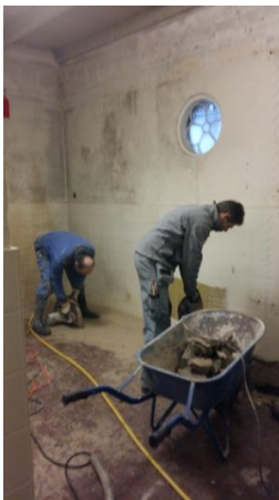
Vorbereiding in de toiletruimte

Zoals u aan onderstaande foto's kunt zien, is de verbouwing in volle gang. De toiletruimte is geïsoleerd en de toiletten zijn bijna klaar. Maar dat is nog niet alles.