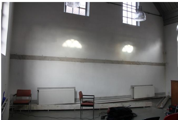
De sjoel zonder spiegelwand.

Ook het keukenblok is geplaatst zodat wij nu beschikken over stromend water en er is een begin gemaakt met de sjoel. Daar is eerst de grote spiegelwand verwijderd en nu kunnen we beginnen met het dichtsmieren van de scheuren, waarna kan worden begonnen met het isoleren.