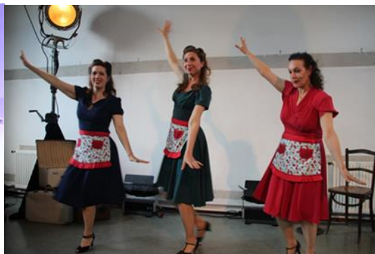
Vermaak tijdens de bezetting