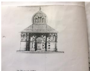
Een nooit gebouwde synagoge in Drenthe

Op Zaterdag 23 juni wordt om 14.00 uur de tentoonstelling 'Drentse synagogen, toen en nu' geopend door de commissaris van de Koning, mevrouw Jetta Klijnsma. Tijdens de voorbereidingen van deze tentoonstelling kwamen we regelmatig voor aangename verrassingen te staan. Bij een globaal onderzoek dachten wij dat er in Drenthe twaalf (huis) synagogen zijn geweest, maar snel kwamen we erachter dat er in de provincie zeker zestien synagogen hebben gestaan. Toen het tentoonstellingsboekje bijna klaar was ontdekten we nog een barak synagoge in het doorgangskamp Westerbork en mogelijk een huissynagoge in Buinen. Dit laatste moet nog verder onderzocht worden. Voor deze tentoonstelling krijgen wij unieke voorwerpen in bruikleen van het Joods Historisch Museum Amsterdam. Voorwerpen die vroeger in Drentse synagogen thuis hoorden. Vrienden en vrijwilligers van de synagoge ontvangen een uitnodiging om de opening bij te wonen. Bent u op 23 juni verhinderd, kom dan gerust eens langs tijdens de openingstijden.