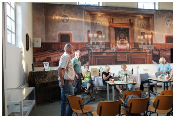
Vrijwilligersavond.