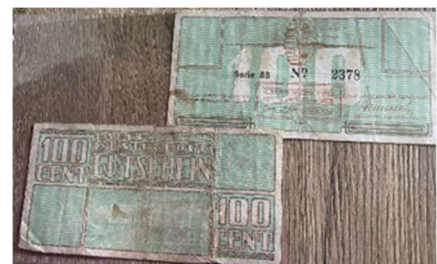
Twee biljetten van 100 cent uit het doorgangskamp Westerbork. Met dank aan A. Moes.

Ook de afgelopen maand zijn we weer verrast met vele geschenken. We danken alle mensen die boeken voor onze bibliotheek hebben gebracht, maar ook waardevolle herinneringsstukken voor ons museum. We kregen onder andere twee biljetten van 100 cent die als betaalmiddel in het doorgangskamp Westerbork zijn gebruikt. Verder hebben we contact gehad met een Joodse gemeente die waardevolle synagoge artikelen aan ons museum in bruikleen wil geven. Zodra dat rond is, zullen we u op de hoogte houden. SSC kreeg ook een kopie van een oude foto van ons gebouw, toen het nog in gebruik was als gebedsruimte. De foto is erg onduidelijk, maar de inrichting is wel te