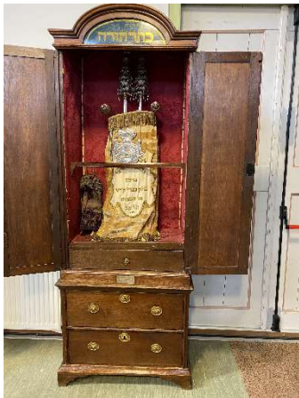
Aron Hakodesh met Thorarol.