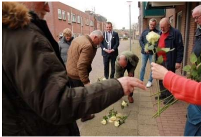
Het leggen van rozen bij de Stolpersteine.