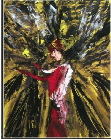
Bettina van Steenis.

Op zondag 26 mei 14.30 uur wordt de schilderijen tentoonstelling Zeven Profetessen geopend met een interactieve bijdrage van de schilderes en omlijst met muziek gespeeld door Luit Kamphuis. In het museum kunt u tot 29 september genieten van 14 schilderijen die samen het beeld van Zeven Profetessen uit het Oude Testament weergeven. Tevens ziet u voorwerpen die passen bij elk van deze profetessen. De schilderijen zijn gemaakt door Bettina van Steenis. Bettina is huisarts en lid van de Liberale Joodse Gemeente Twente en schildert al jaren.