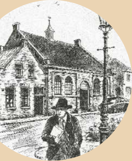
Foto rechts: Joods monument Coevorden, door Wouter van Rossem 1985

'Een mens is pas vergeten als zijn naam vergeten is'