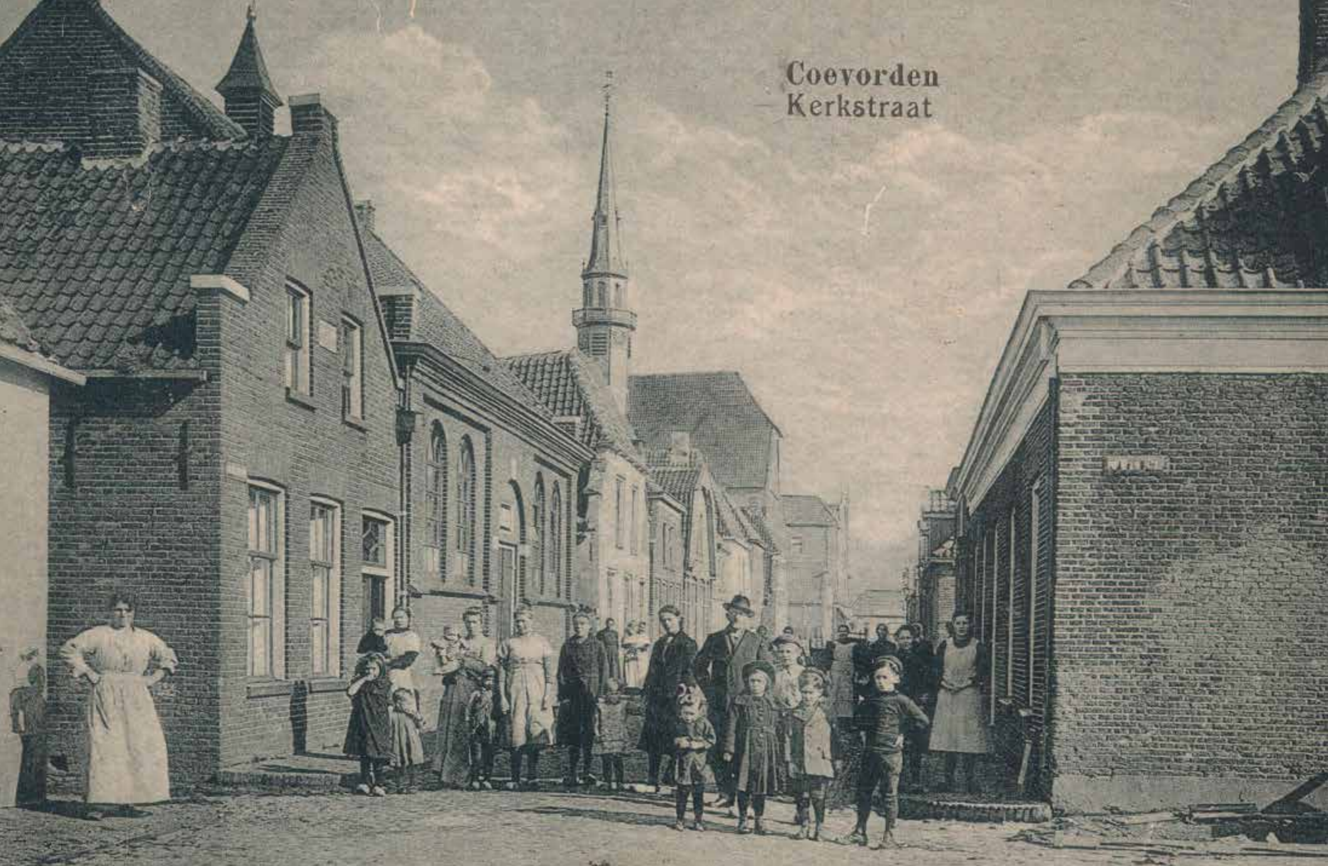
Het Joodse leven in Drenthe