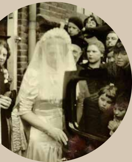
Joodse bruiloft 1938

De rabbijn verzorgde in Coevorden iedere zaterdag de gebedsdienst. Kinderen gingen overdag naar de openbare school en bezochten daarna de eigen school om zich in het Hebreeuws, de Joodse geloofsleer en de Joodse geschiedenis en gewoontes te bekwamen. De Joden vormden een onlosmakelijk deel van de Coevorder gemeenschap. Zo telden zij verschillende leden van de gemeenteraad en waren bestuurslid van bijvoorbeeld handelsverenigingen en het Groene Kruis.