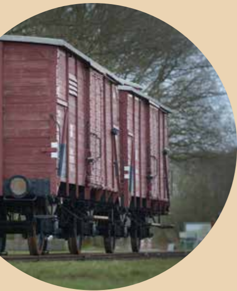
Transportwagon kamp Westerbork