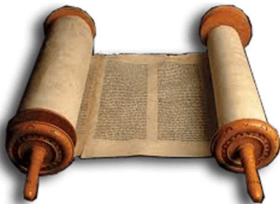
Aanwezigheid van de Thora is wenselijk voor het synagoge-museum

Eén van de wensen is het financieel gezond en draaiend houden van het synagoge-museum. Om financieel gezond te zijn en te blijven, hebben wij een verzoek ingediend bij de gemeente Coevorden om het synagoge-museum financieel te ondersteunen. De gemeente staat daar niet onwelwillend tegenover en heeft opdracht gegeven voor een onderzoek naar de toekomst van het museum. De belangrijkste vragen die daarin beantwoord moeten worden zijn: is de bevolking van Coevorden op de