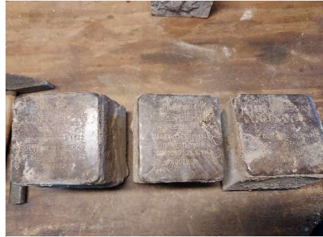
Stolpersteine die in de Sallandsestraat onder de bouwplaten waren verdwenen.

de Joodse begraafplaats plaatsen. Tevens houden inwoners van Coevorden ons op de hoogte van de al geplaatste Stolpersteine. Door bouwwerkzaamheden verdwijnen gelegde Stolperstenen soms letterlijk en figuurlijk onder de bouwplaten. Gelukkig zijn er altijd mensen die ons daarop attent maken. Zo ook in de Sallandsestraat. De Stolpersteine zijn weer uitgegraven en schoon gemaakt, ze moeten nu nog gepoetst worden en opnieuw gelegd als de bouw is afgerond. U ziet, het is vakantie, maar SSC zit niet stil en dit zijn nog niet eens al onze wensen. Er zijn voldoende plannen om het synagoge-museum voor de toekomst uit te bouwen en aantrekkelijker te maken voor bezoekers.