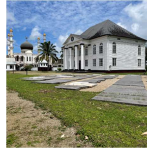
De synagoge in Paramaribo is in 1837 gebouwd en staat naast de moskee.

dat vroeger, toen veel synagogen van hout waren gebouwd, de vloer bezaaid was met een laag zand? Dit zien we nog steeds in houten synagogen. De functie van dit zand blijkt drieledig te zijn: 1. Het herinnert de mensen er tijdens hun bezoek aan, dat Mozes de Joden vanuit Egypte, via de woestijn, naar het beloofde land heeft gevoerd. De twee andere redenen zijn meer praktisch van aard: 2. Toen het voor Joden verboden was, of het hun moeilijk was gemaakt om hun geloof te belijden, dempte het zand het geluid, zodat buiten weinig van de dienst te horen was. 3. Omdat vroeger kaarsen werden gebruikt voor de verlichting, fungeerde het zand om brand te voorkomen. Als een brandende kaars omviel, dan werd hij meteen gedoofd in een laag zand. Of dit klopt is nog niet duidelijk, maar het werd verteld in de synagoge te Paramaribo.