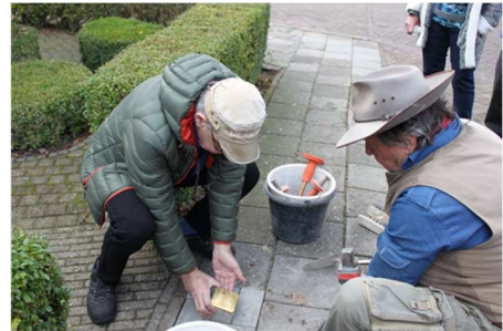
In 2014 legt Kunstenaar Gunter Demnig in Coevorden de eerste Stolpersteine.

In 2014 werden in Coevorden de eerste 5 Stolpersteine gelegd en op woensdag 20 maart , vanaf 14.00 uur in het Synagoge-museum , gaan wij weer Stolpersteine onthullen. Die dag worden 10 Stolpersteine onthuld, waarmee dan 118 van de 137 Stolpersteine zijn gelegd. De laatste 19 Stolpersteine worden in het najaar van 2024 en voorjaar van 2025 gelegd. In het voorjaar van 2025 geven wij ook een Stolpersteine-boek uit, waarin de verhalen zijn opgenomen van alle mensen uit de huidige gemeente Coevorden, die tijdens de Holocaust zijn vermoord.